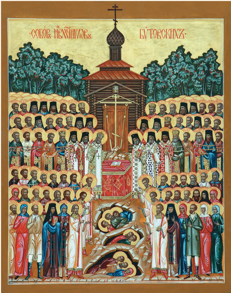
Новомученики Бутовские. Сцмч. Николай у подножия престола справа