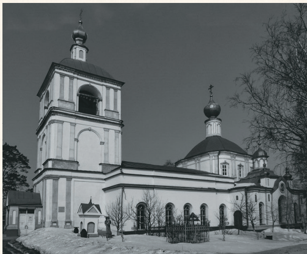
Успенская церковь села Обухово