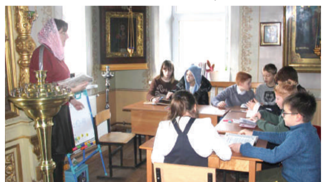
На уроке «Закон Божий» в воскресной школе

больше входила радость. Неспроста нам Бог дал столько детей — столько радости, чтобы мы уподоблялись детям в простоте,