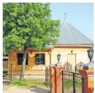
Приписной храм-часовня сщмч. Николая Пятницкого д. Тараканово

14 ноября тройка НКВД приговорила его к расстрелу. Священник Николай Пятницкий